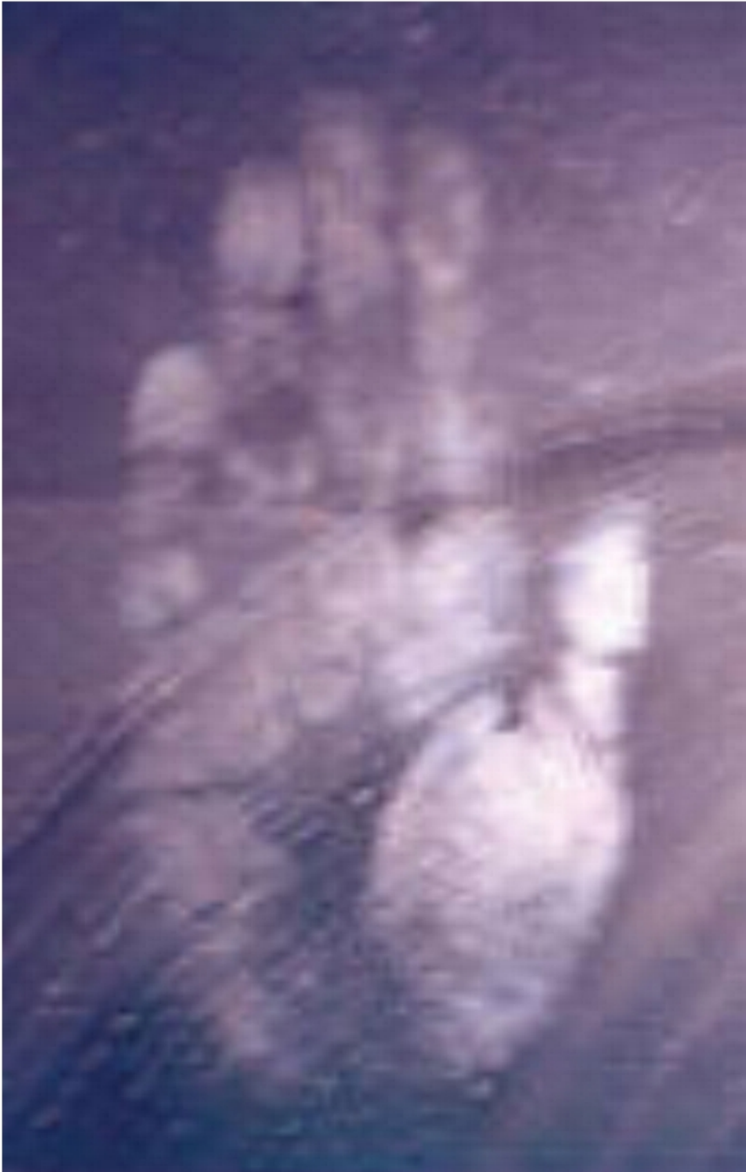
Το Χέρι του Μαϊτρέγια