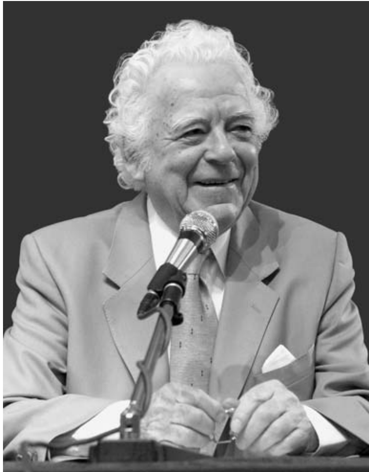
Ο Μπέντζαμιν Κρεμ