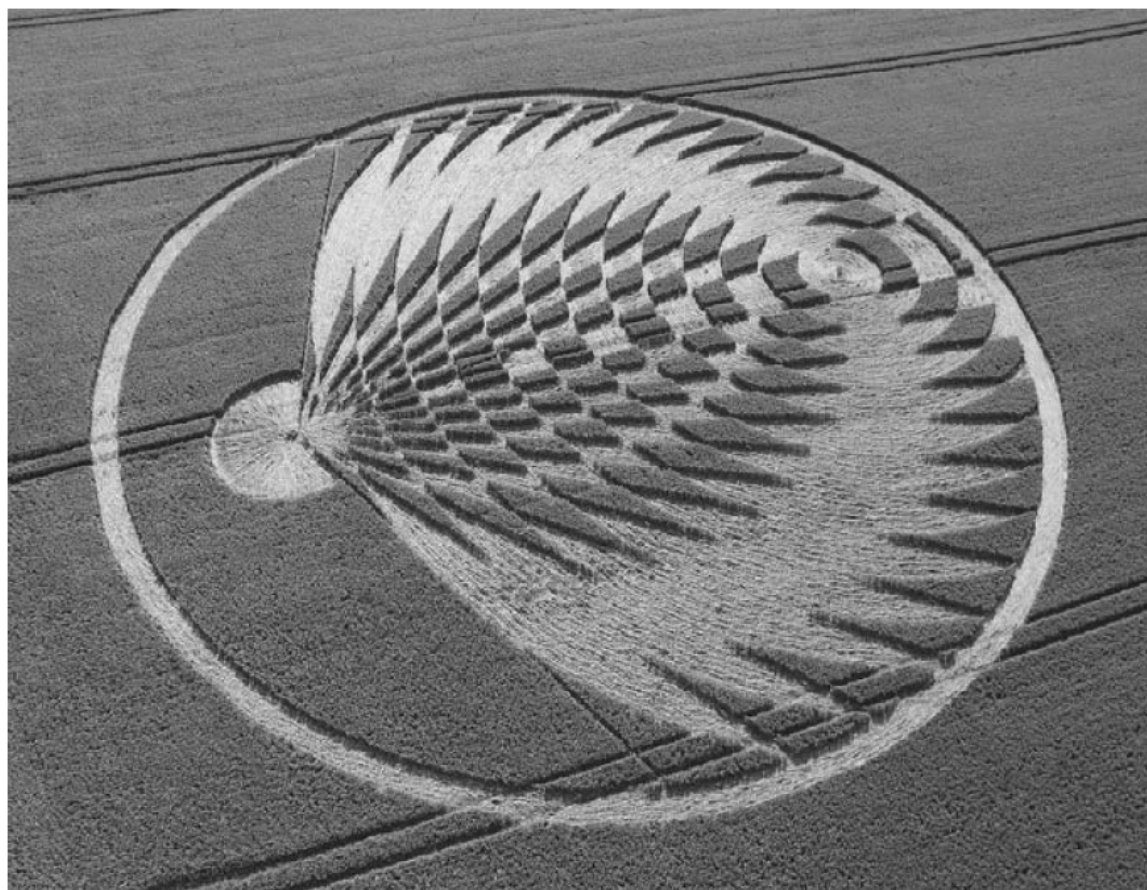
Uffington Castle, Oxfordshire, Αγγλία, 8 Ιουλίου 2006.