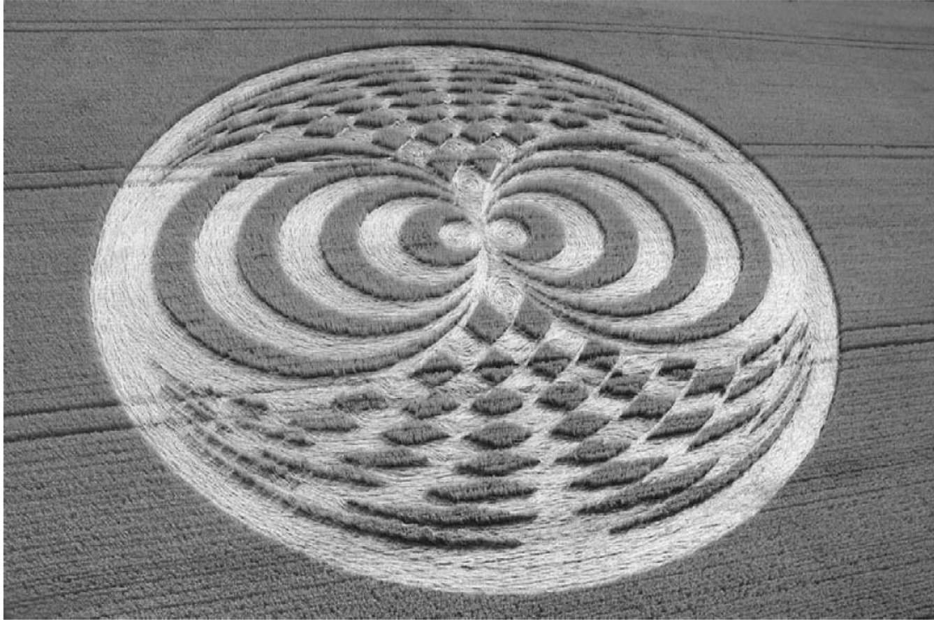
Straight Soley, Berkshire, Αγγλία, 20 Ιουλίου 2006.